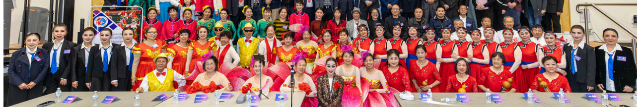
▲ 悉尼中老年多元文化节 风采展，温暖绽放，共话多元文化，共筑社区未来。