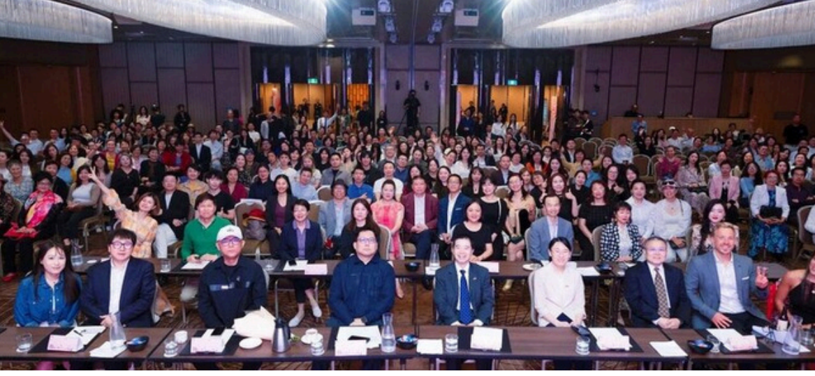
▲ 《非诚勿扰》澳大利亚专场新闻发布会在悉尼香格里拉大酒店隆重举行

《非诚勿扰》开播至今，共制作了21个海外专场，打造了极具全球影响力的文化品牌与情感社交平台，成为连接全球年轻人情感世界的重要纽带。