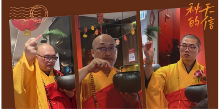
▲ 让我们携手，为般若寺的未来贡献一份力量！

2025年3月18日 星期二 E-Mail: smp88@optusnet.com.au