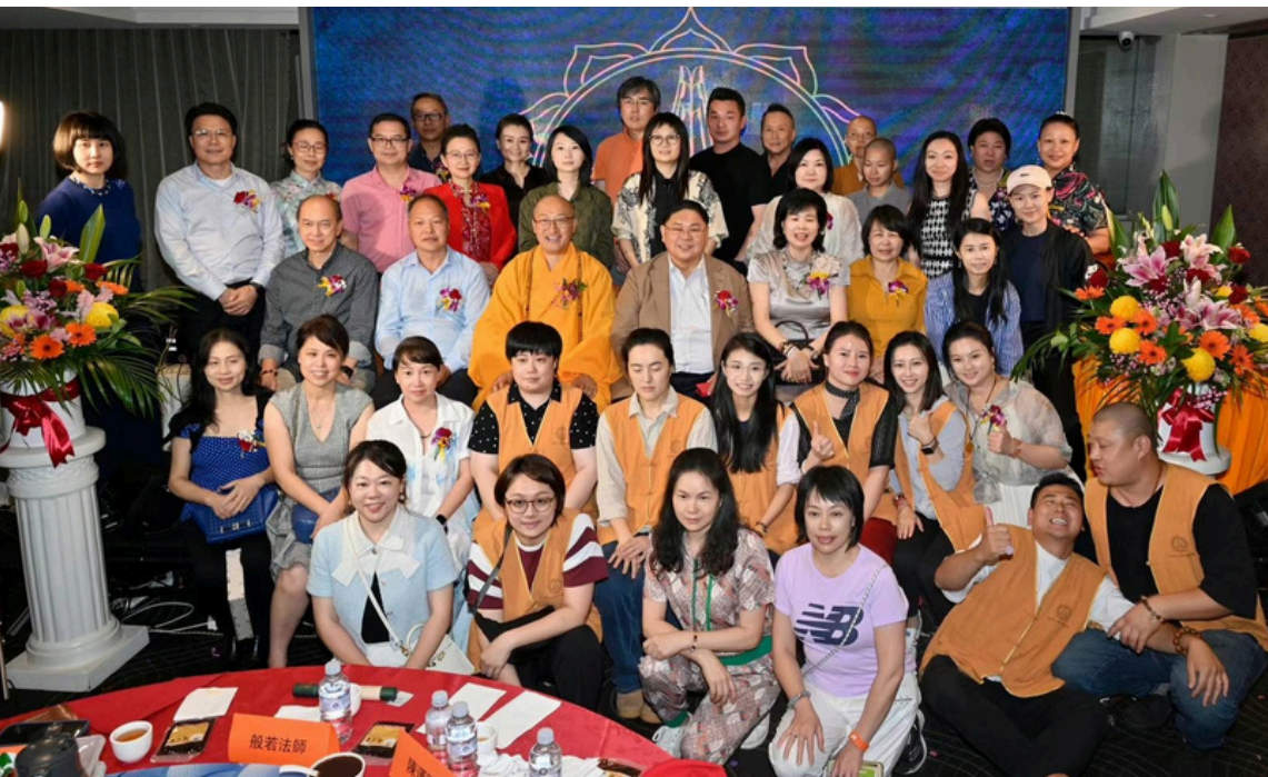
▲海外迷雾重重遮天幕，南无灯塔指引归途路。般若横空出世耀乾坤，般若之光再现心灵驻。