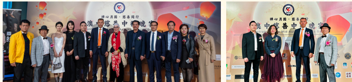
▲ 嘉宾云集，共襄慈善盛会，吸引了超过1000位嘉宾