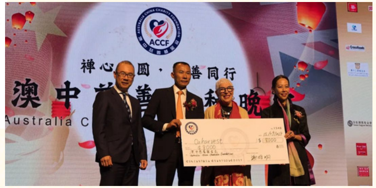
▲ “澳中慈善中秋晚宴”在悉尼市政厅温馨举行

2024年9月17日 星期二 E-Mail: smp88@optusnet.com.au