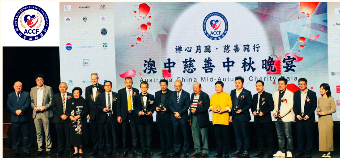
▲ 晚宴特别颁发了“爱心合作伙伴”和“慈善之星奖”