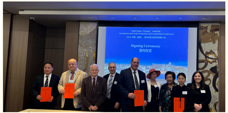
▲ 中国(益阳)-澳大利亚投资贸易推介会在悉尼圆满举行

2024年8月29日 星期四 E-Mail: smp88@optusnet.com.au