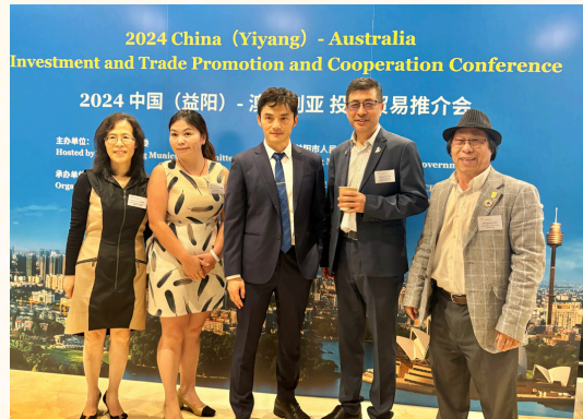
▲ Philip Ruddock阁下，前澳大利亚移民部长，强调了中澳两国之间的好关系及互利合作的重要性。他在致辞中指出：“中澳之间的合作不仅局限于贸易和投资，还涉及到科技、教育、文化等多领域。两国应继续加深交流与合作，互相学习，共同发展。我相信，通过此次推介会，中澳企业家能够发现更多的合作机会，为两国关系的进一步深化做出贡献。”